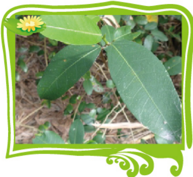
山猪枷的特寫照，讓你看得更清楚

常綠中小喬木，小枝、幼葉和花序均被褐色星狀柔毛。果實表面的深褐色毛茸是一種腺體，有毒，能殺死寄生蟲；可提煉紅色或橙色染料。